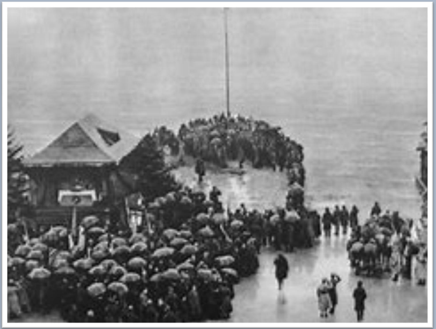
Zaślubiny Polski z morzem w Pucku, 10 lutego 1920 r.

W dniu zaślubin Polski z morzem Ks. Wrycza wygłosił kazanie podczas mszy polowej, w którym znalazły się takie oto słowa świadczące o wielkiej miłości do Polski i Kaszub, jego ziemi rodzinnej: (...) I otóż dzisiaj nadeszła ta chwila historyczna, w której Kaszubi Ojczyźnie oddają w posiadanie ten klejnot, uporczywie w zaciętym boju strzeżony. Morze to nasze piękne, ukochane polskie morze dzisiaj wraca pod skrzydła opiekuńcze Orła Białego. Polsko, Ojczyzno moja nad życie ukochana (...).